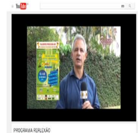
PROGRAMA REFLEXÃO Grann Dourados - Programa Reflexão: https://www.youtube.com/watch?v=3vmsmfEj34