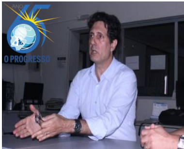
Jornal O Progresso

MÍDIA – ESPONTÂNEA , o evento mobilizará sem custos diretos, diversos veículos de publicidade. (Exemplificação com base em um evento com o tema “cana” em 2015)