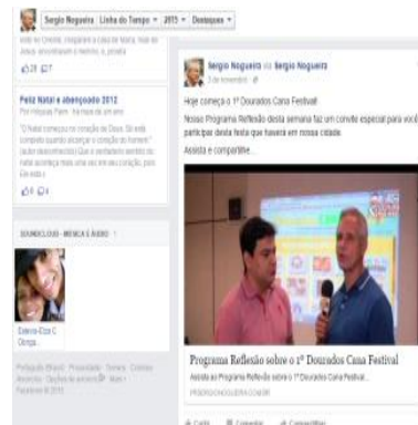
FACES e SITES