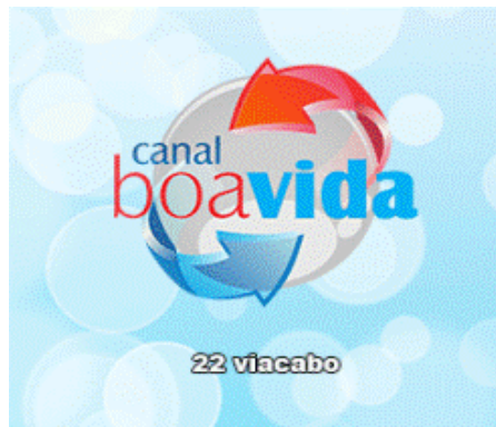
Canal Boa Vida