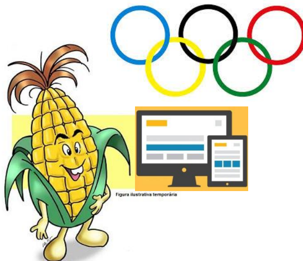
Figura ilustrativa temporária

- Qual a entidade que realiza eventos culturais e educacionais com temas voltados a agricultura, em apoio ao turismo receptivo e ao COMÉRCIO de Dourados-MS, com vistas a promoção do emprego e da renda para o desenvolvimento local? A.( ) Agências de Viagens / B.( ) ABEOC-Associação Brasileira de Organizadores de Congressos / C.( x ) Associação para o Desenvolvimento do Turismo Receptivo de Dourados-MS (Dourados-MS Receptivo)”.